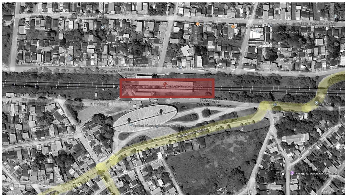
FIGURA 1 – ESTAÇÃO COSME E DAMIÃO